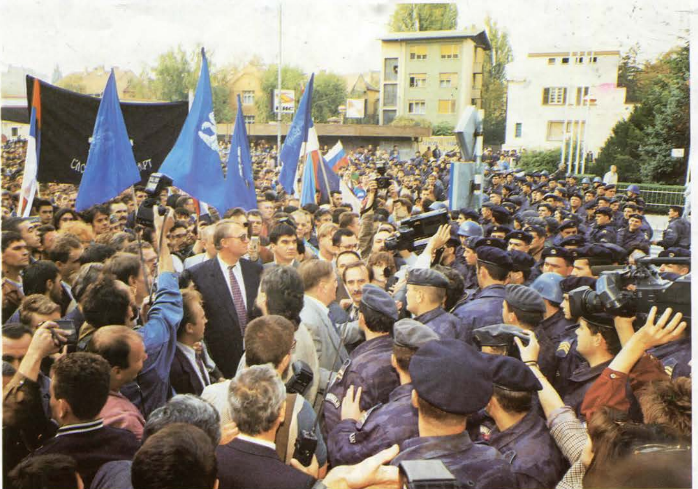
Радикали су за село град и поштен рад!