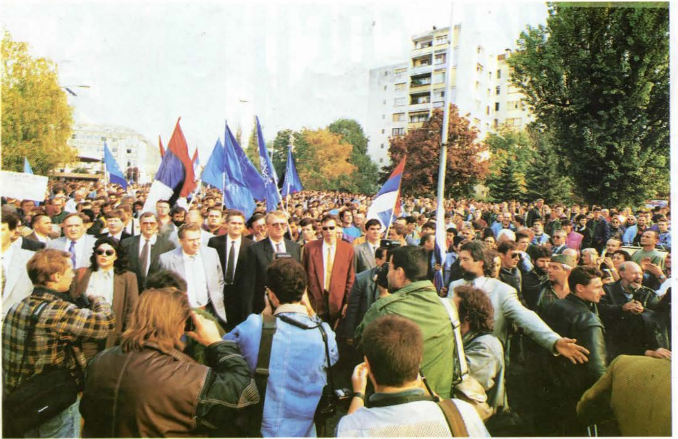
Србија је вечна док су јој деца верна!