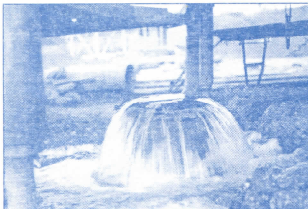
Подземна карстна акумулација - Мионица

Из изложеног произилази да изворишта у виду карстних подземних акумулација морају постати окосница у снабдевању становништва Врњачке Бање квалитетном водом за пиће. Осим тога воде ће се масовно користити и за друге потребе, пре свега за пољопривредну производњу, затим у спортско-рекреативне и балнео-терапеутске сврхе, за флаширање као стоне пијаће воде због свог беспрекорног квалитета итд. Значи поред решења проблема водоснабдевања отвара нам се и страховита развојна шанса.