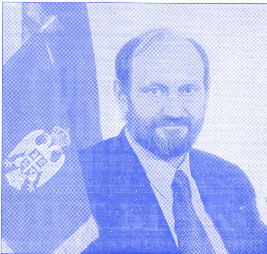
Председник Републике Српске и Српске радикалне странке Никола Поплашен

Неспремност Републике Српске за учешће на донаторској конференцији није могла бити превазиђена ниједном скупштинском одлуком. Та неспремност резултат је