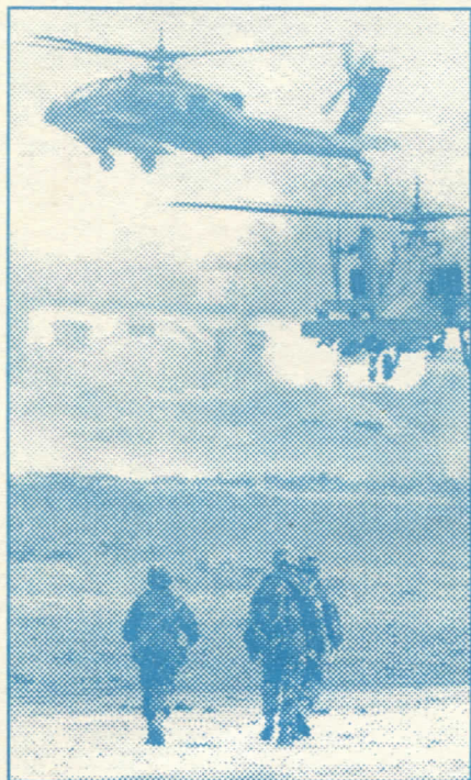
Ловци на Србе: уз сагласност Додикове владе припадници СФОР-а ведре и облаче Републиком Српском