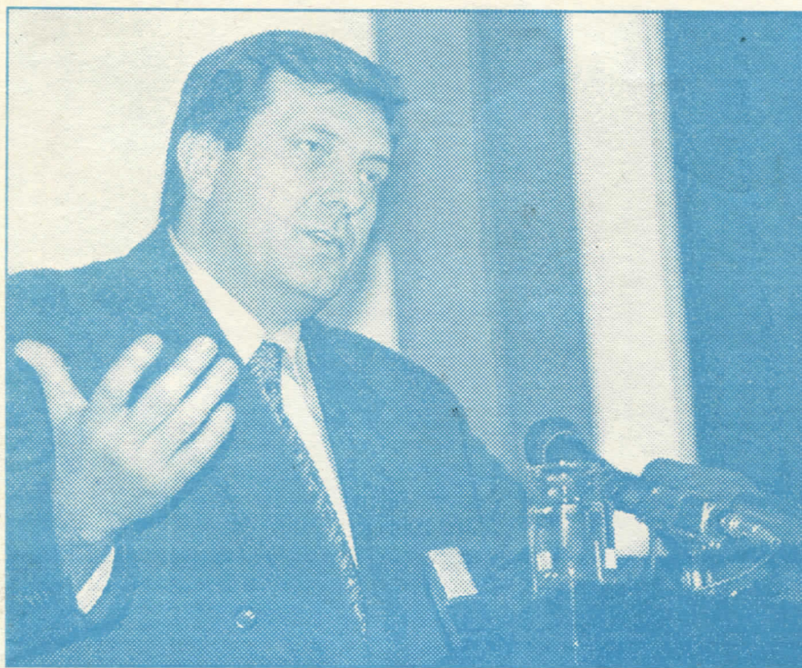
Нема разлике између потурица и америчких послушника и једни и други су издајници српског народа

Последица такве политике су бројне одлуке наметнуте Републици Српској од стране међународних организација којима се вређају Дејтонски принципи и воља грађана.