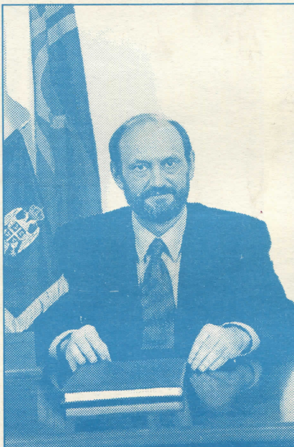
Председник Републике Српске Никола Поплашен

На нашу несрећу, пад и разарање Републике Српске почело је од доласка на власт коалиције "Слога". Део људи који обављају значајне политичке функције, а који су челници коалиције "Слога", својом политиком континуираног попуштања на штету Републике Српске и сарадњом са странцима у доношењу и реализацији противдејтонских, противуставних и недемократских одлука, будућност Републике Српске чине неизвесном. Њихова неспремност да личне и