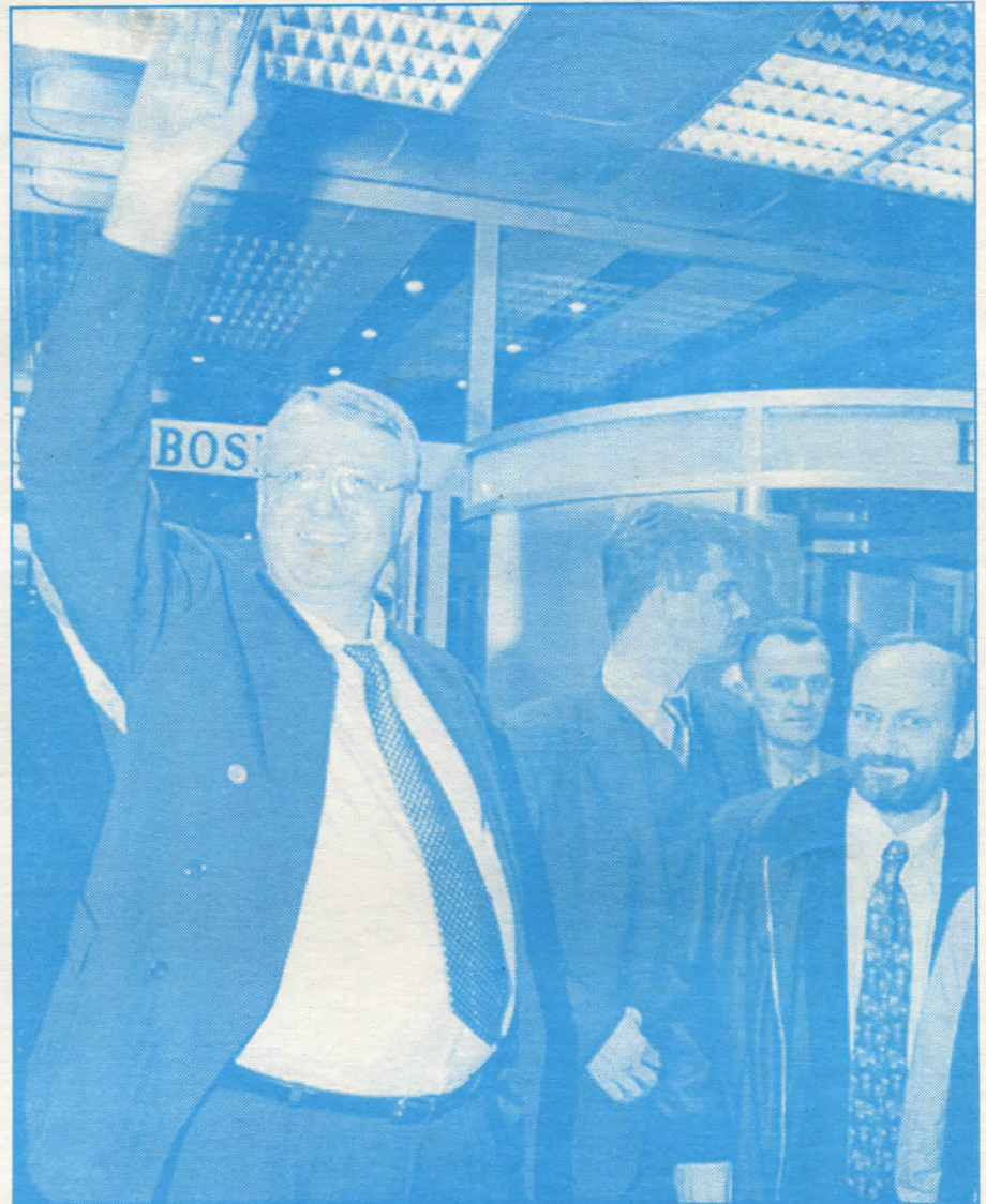
Тренутак када је др Војислав Шешељ под присилом окупатора и његових слугу напустио Републику Српску

Ми, српски радикали, увјерени смо да смо водећи овакву политику радили у ин-