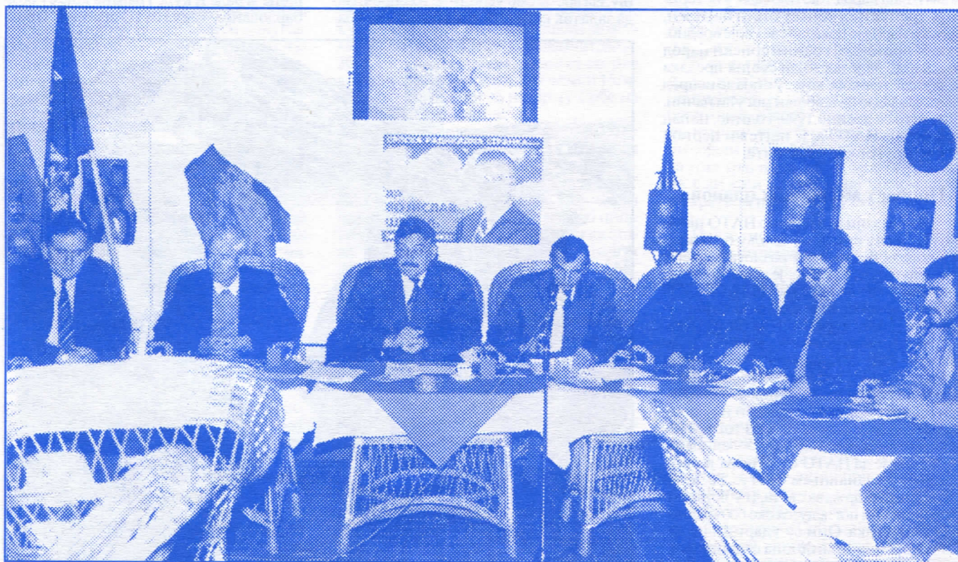
Руководство Општинског одбора Српске радикалне странке, Гацин Хан