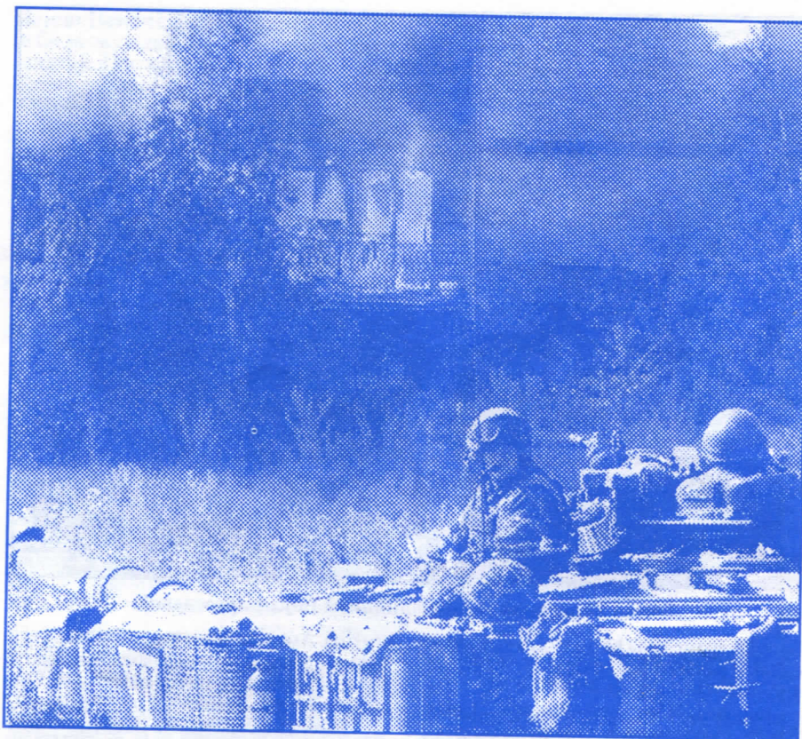
Српска кућа запаљена у присуству КФОР-а

За време краткотрајног рата на Косову и Метохији, сећате се тог периода, када је на Косову боравила посматрачка мисија из ОЕПС-а на челу са Вилијамом Вокером, нисмо могли да дођемо до података о злочинима које су извршили шиитарски терористи. Подсетио бих вас на догађаје у месту Рачак, и на злочин у Старом Гратском када су дошле снаге КФОР-а, када су Шиитари извршили злочин над српским становништвом. Јуче је изнета шифра да је 800 људи убијено, да је 700 људи киднаповано и не зна се број људи којима се изгубио траг на Косову и Метохији. Такође, огроман број српских кућа је запаљен, имовина предузећа је покрадена и однесена у Албанију. Све то показује да се радило по плану који су направили Американци како би потпуно отели Косово и Метохију из Србије, како би од Косова и Метохије направили посебну републику. Они се декларативно слажу са Резолуцијом Савета безбедности 1244, по којој су недвосмислено Косово и Метохија део Савезне