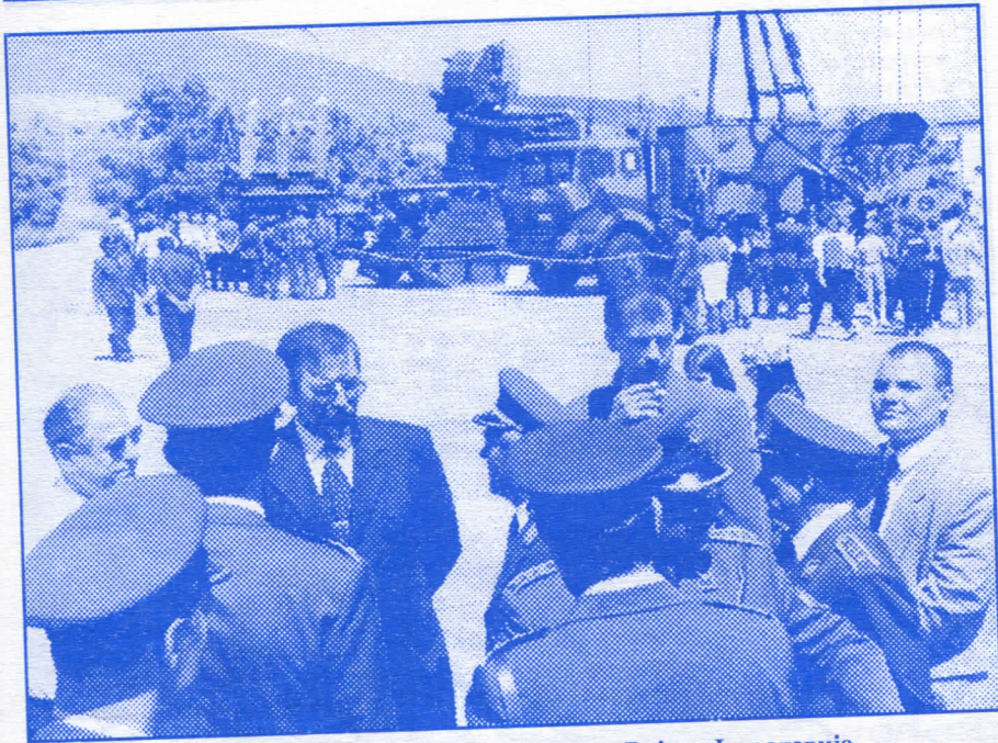
Драган Тодоровић са припадницима Војске Југославије

ће доћи време када ће он и они који раде са њим морати да одговарају за ратне злочине.