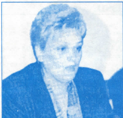
Мр Јованка Табаковић