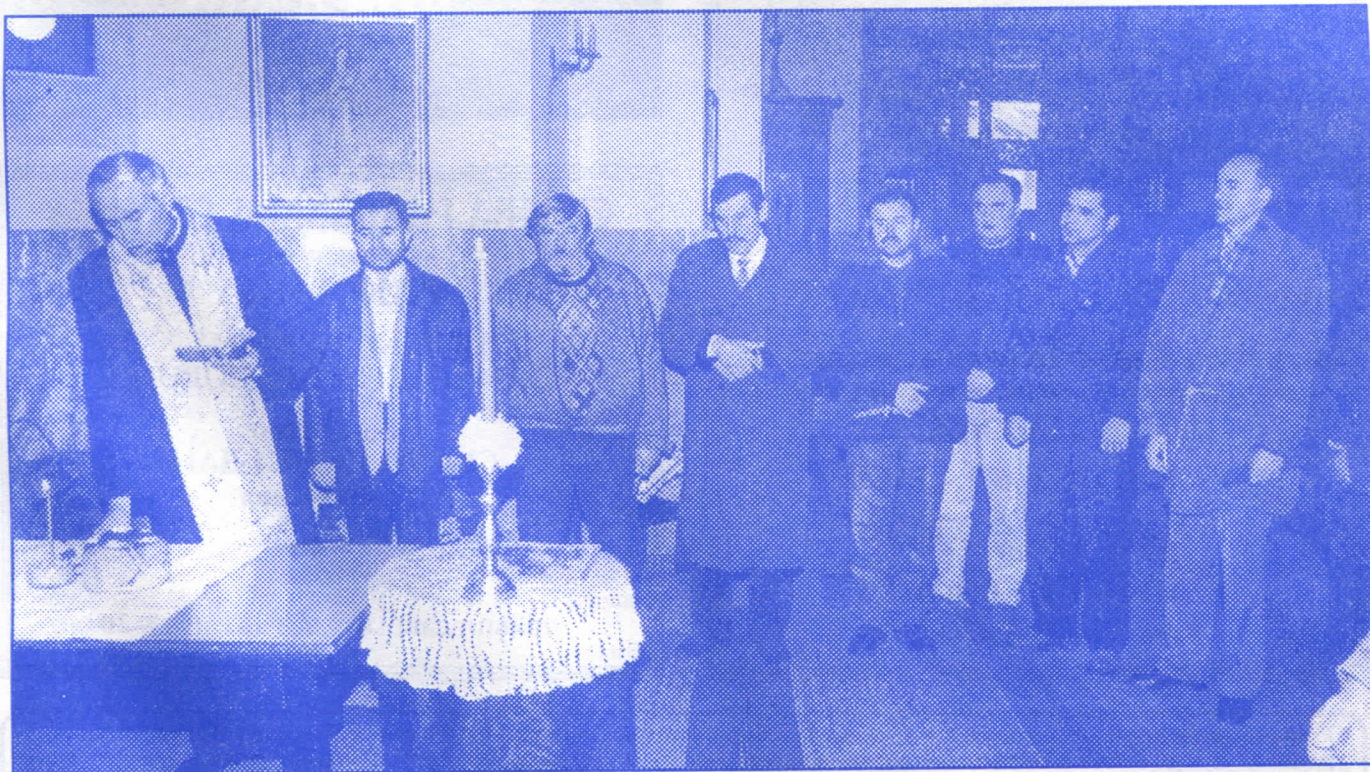
Чување традиције: Света три јерарха, слава српских радикала

Прво би кренули са увођењем реда у ове послове тако што би сва гробља била ограђивана и конзервирана, затим би се извршило ажурирање и утврђивање стања свих гробница, довођење воде и осталих комуналних потреба и одређивање радника који ће гробље одржавати.