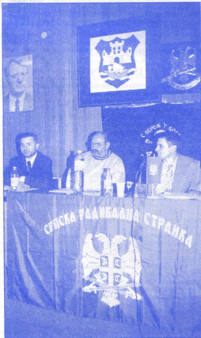
Председништво Општинског одбора Раковица

Страначком хроником на адекватан начин биће заступљене све странке које имају своје одборнике у СО.