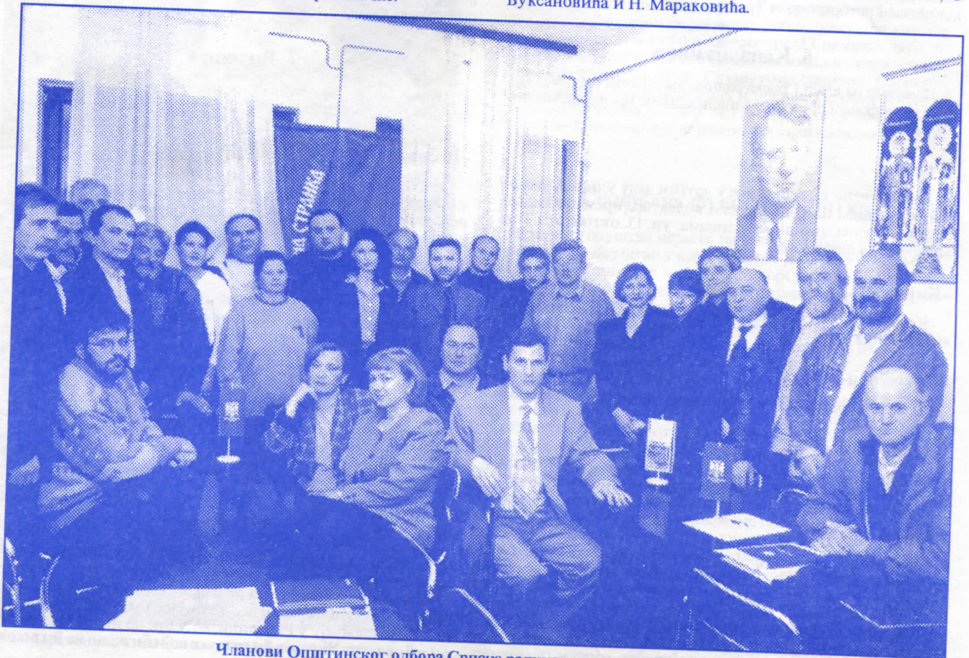
Чланови Општинског одбора Српске радикалне странке Раковица

Поправка асфалта у ул. Вукасовићева до броја 92, од ул. Велизара Станковића до Горице (траса аутобуске линије 48) изградња паркинг простора у улицама Вукасовићева, С. Вуксановића и Н. Мараковића.