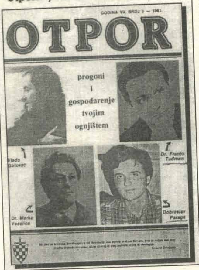
Без коментара: насловна страна хрватских младоусташа

У загребачком недељном листу Глобус, на чијој насловној страни још стоји да се ради о националном „тједнику“, у броју 480, који је изашао 18. фебруара ове, двехиљадите године, пронашли смо фељтон о Гојку Шушаку,