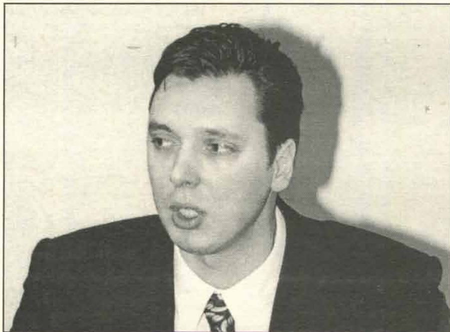
Александар Вучић: НАТО агресија на нашу земљу се наставља само другим, перфиднијим средствима

Одговорност према послу и према људима, је основна особина свих српских радикала. Не треба посебно говорити о одговорности, као ни способностима Александра Вучића, јер оне су добро познате и његовим политичким неистомисљеницима, а наравно, и обичним људима, који се политиком баве искључиво гледајући политичке емисије. Политика је саставни део његовог бића, а патриотизам саставни део његове личности. Такав је Вучић био и као средњошколац, а такав је и данас, када обавља функцију републичког министра за информације. Александар Вучић је увек добродошао у сваки општински одбор, широм наше земље и наравно, сваки пут је, просто, затрпан гомилом разноразних питања, на која увек од-