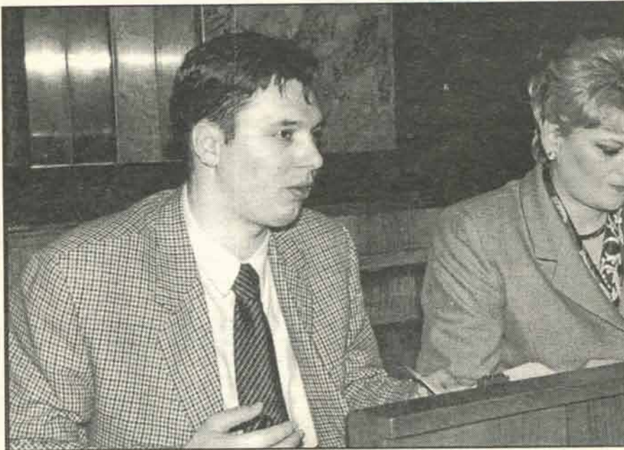
Срамна улога Запада: у свету није забележена овако прљав и подла кампања против једне суверене земље

Српска држава, па и Министарство за информације владе Републике Србије, наставиће своју борбу и разоткривати лажи, обмане и фалсификате српских непријатеља и Вучић мисли, да ће Србија у томе имати много више успеха, него што је то био