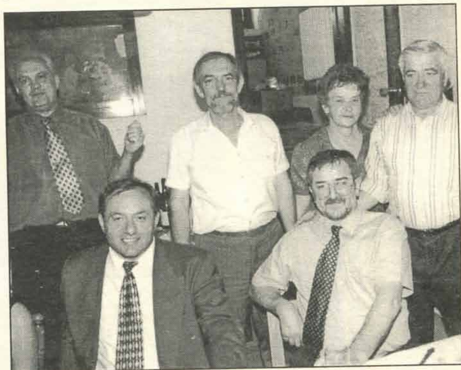
Увек драги гости: Драган Тодоровић, потпредседник Републичке владе и министар вера Милован Радовановић

постао прави пријемник жеља и потреба својих комшија и суграђана Бежанијске Косе. Кроз контакте са грађанима ови људи утврђују приоритете, које треба решавати, а истовремено утврђују политички став грађана према Српској радикалној странци. Мора се признати, по великом броју приступница, да из дана у дан, српски радикали постају бројнији.