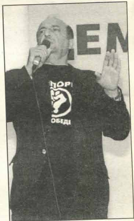
Ко у Србији уводи поздрав који је осмислио усташки злочинац Лубурић