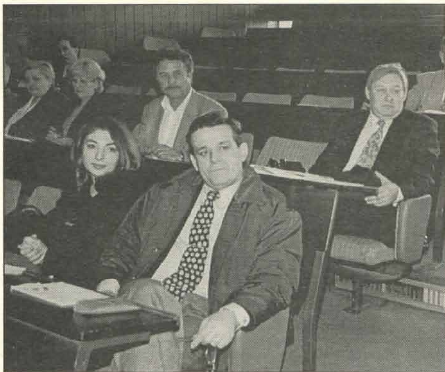
Немар актуелне градске власти највидљивији је у насељу Старо сајмиште

Дакле, о инфраструктури овог насеља, комуналним проблемима требало је много раније повести рачуна. Нажалост, функционери Брозове највеће