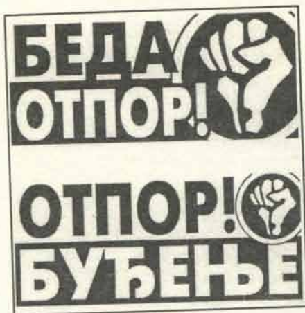
Случајно или намерно, дело западних ментора

У загребачком недељном листу Глобус, на чијој насловној страни још стоји да се ради о националном „тједнику“, у броју 480, који је изашао 18. фебруара ове, двехиљадите године, пронашли смо фељтон о Гојку Шушаку,