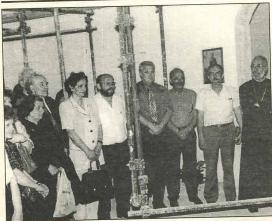
Чланови и активисти месног одбора на литургији у недорученој цркви „Св. Василија Острошког“