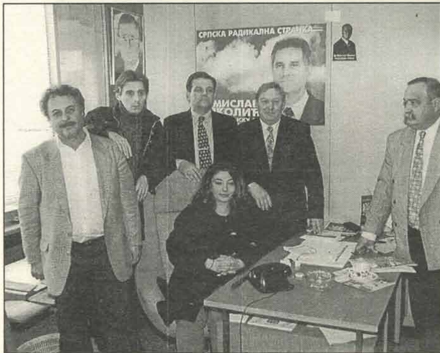
Иако је изостала помоћ Општине, многе акције су успешно проведене