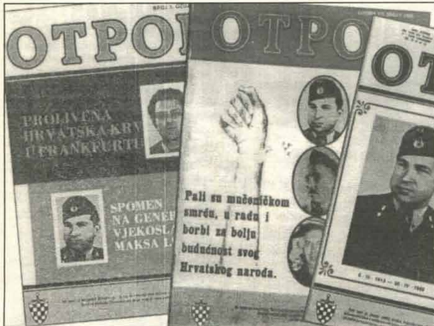
Стиснута песница, усташки симбол

Да ли је случајно, што је недавно Студентски покрет ОТПОР променио име у Народни покрет Отпор, баш по угледу на свог старијег брата, Хрватски Народни Отпор?