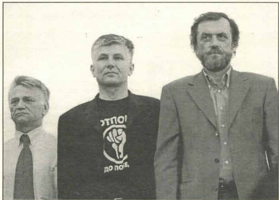
Бинђић и остали послушници Запада поносе се усташким симболом

јатно асоцирају на тридесете и четрдесете године у Италији, и на један покрет, који је свету, а зашто не рећи, и нашој земљи донео много зла.