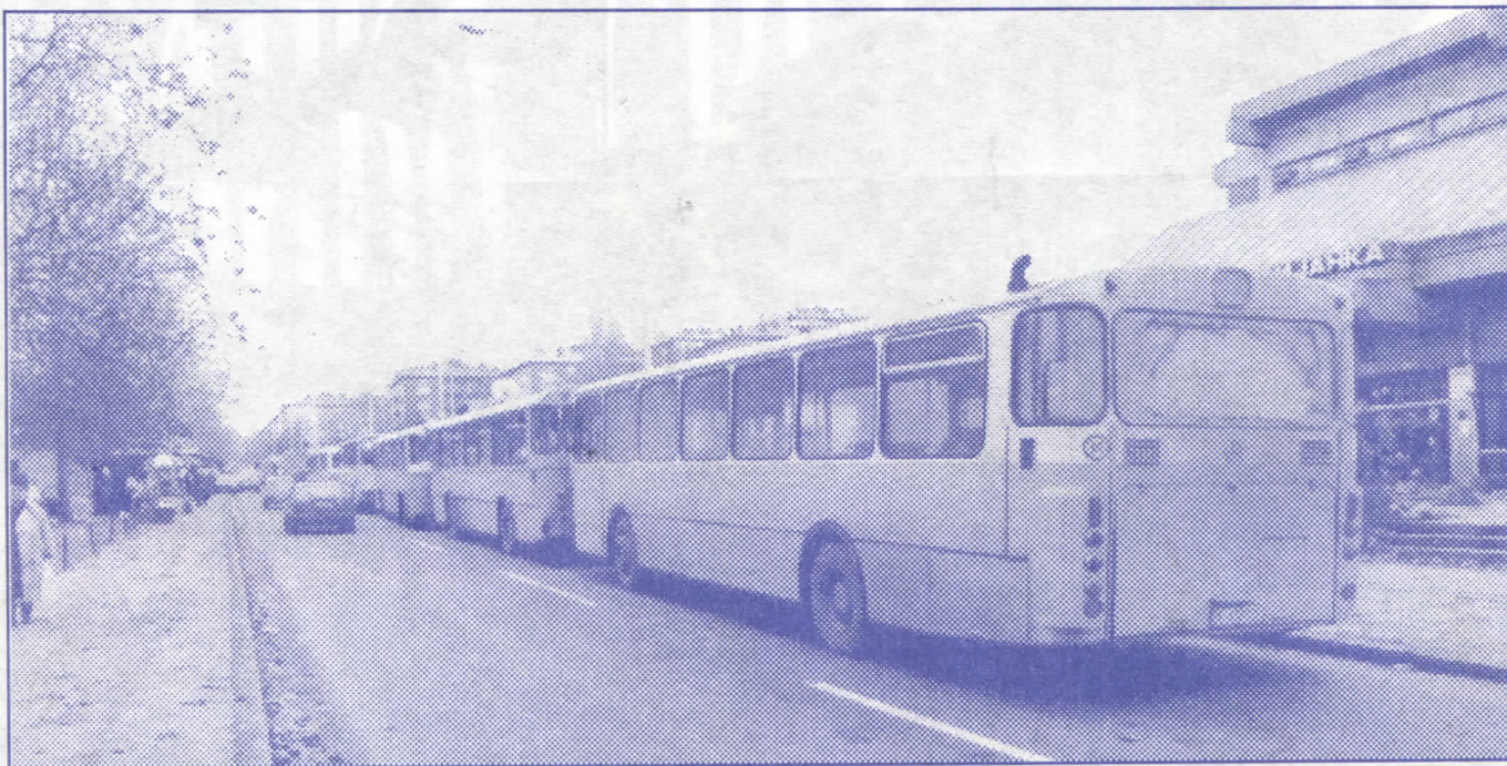
Санација саобраћајница и побољшање превоза у приградским местима један од програмских циљева Српске радикалне странке