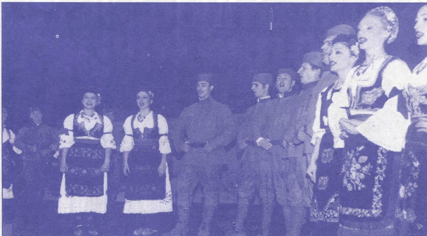
Враћање коренима: општина Земун обезбедила све потребне услове за рад КУД-а "Бранко Радичевић"