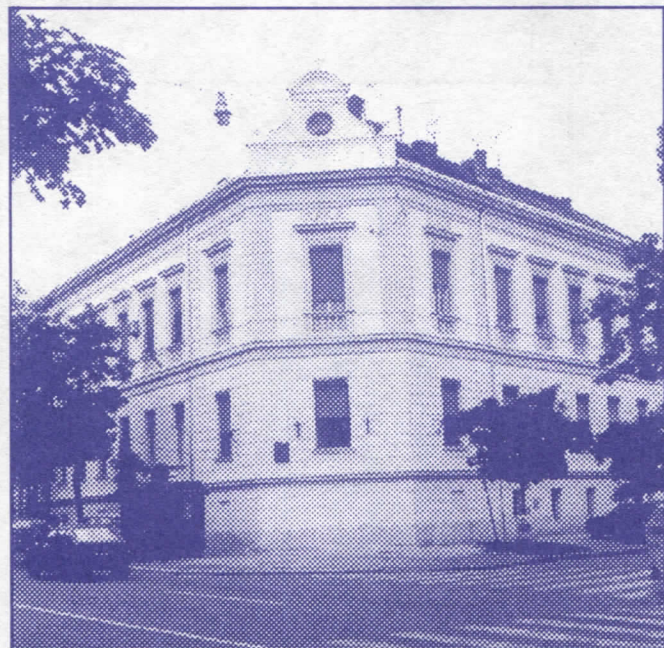
Општина Земун је "умила" свој строги центар: једна од многобројних реновираних фасада у Главној улици

– залагаћемо се за чишћење, поправку и изградњу кишне канализације где се за тим укаже потреба.