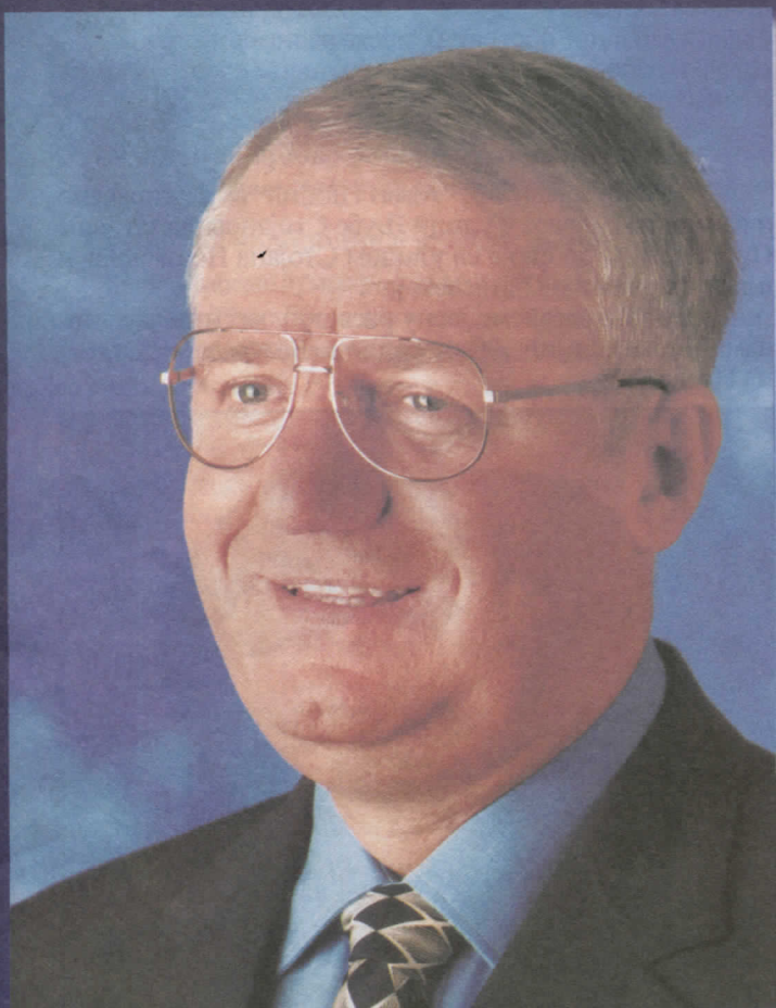
др ВОЈИСЛАВ ШЕШЕЉ ПРЕДСЕДНИК СРПСКЕ РАДИКАЛНЕ СТРАНКЕ