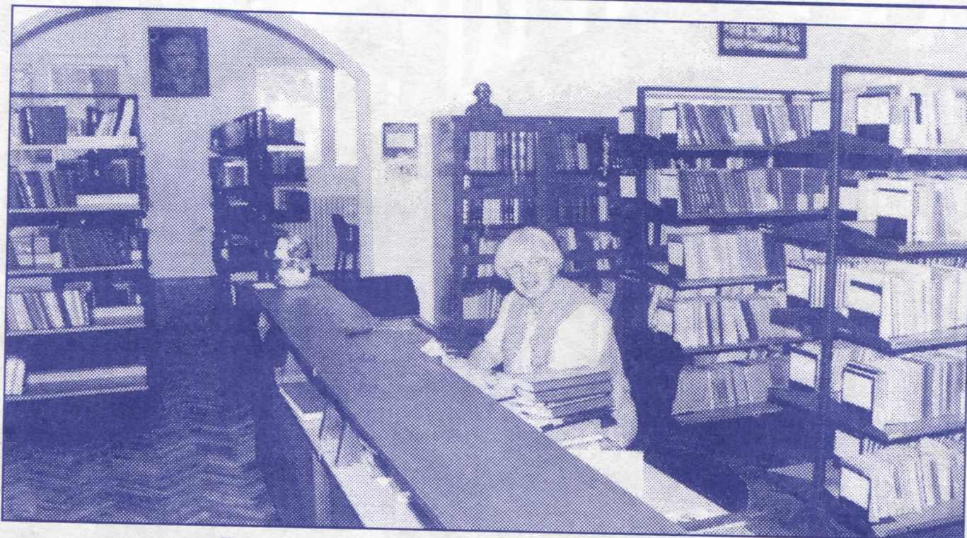
Лепо и корисно: реновирати и опремити библиотекарску делатност

Заштита, развој и унапређење животне средине представљају императив здравог и хуманог живота у урбаној средини какав је Београд. Управо је овај аспект живота до сада у доброј мери био потцењен и неоправдано бачен на маргину интересовања градске власти.