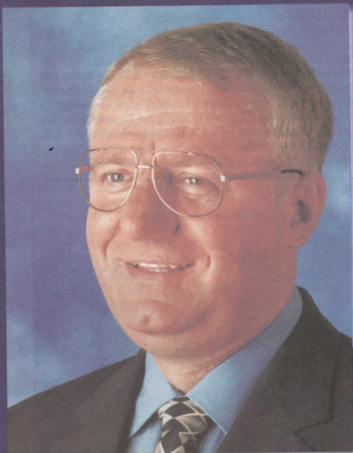
др ВОЈИСЛАВ ШЕШЕЉ ПРЕДСЕДНИК СРПСКЕ РАДИКАЛНЕ СТРАНКЕ