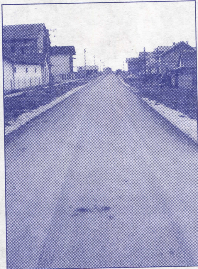
Овако раде српски радикали