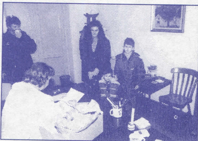
Хуманост на делу: помоћ деци палих бораца

– у Стублинама санираћемо постојеће саобраћајнице и асфалтирати Перићев крај, Златићев крај и пут Обрадовића до Дубраве,