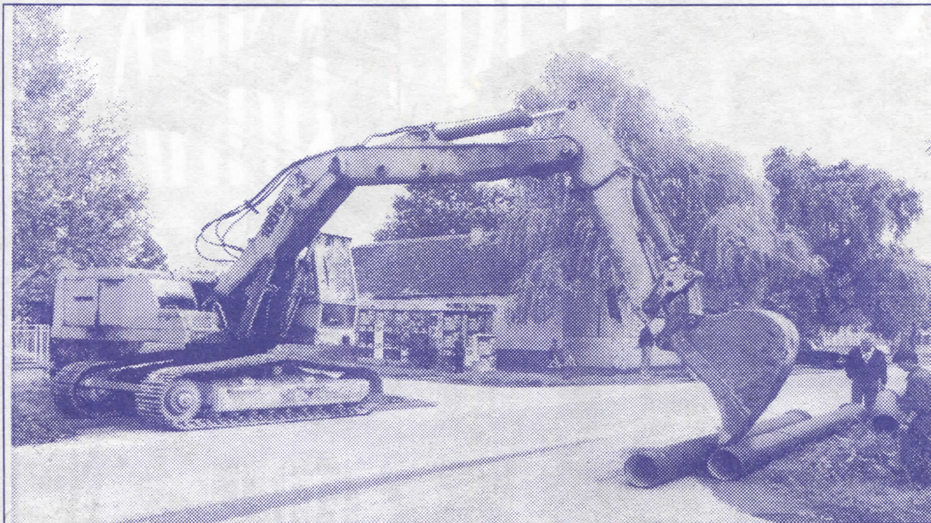
Дела говоре сама за себе: урађена водоводна и канализациона инфраструктура у Земуну