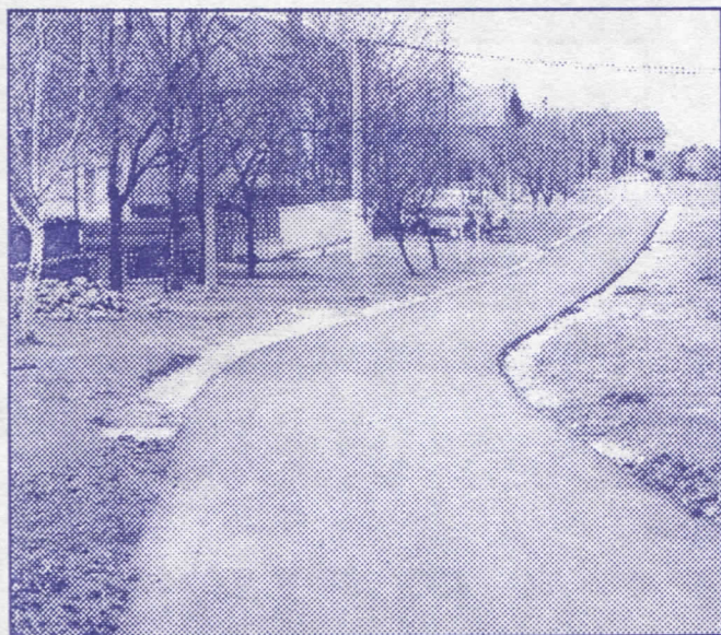
Радикалски подвиг: у сваком насељу квалитетна саобраћајница