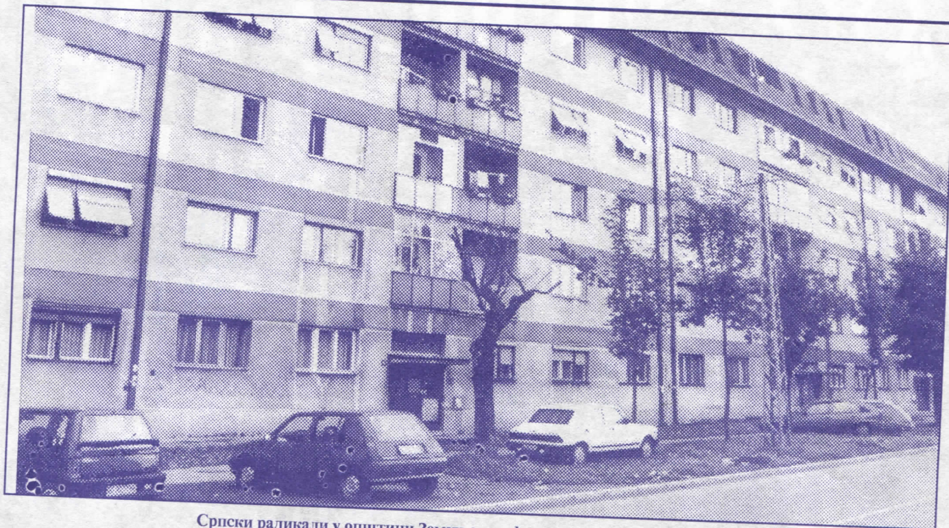
Српски радикали у општини Земун омогућили откуп преко 600 станова

Приморавајући их да живе не у престоници, већ у ка-саби, челници су грађанима одузели достојанство. За ње-гов повратак једино се залагала Српска радикална стран-ка, застудиањем грађана на ретким седницама Скупштине града, онолико колико јој је то било дозвољено, јер је сваки покушај побољшања живота грађана у старту сан-кционисан.