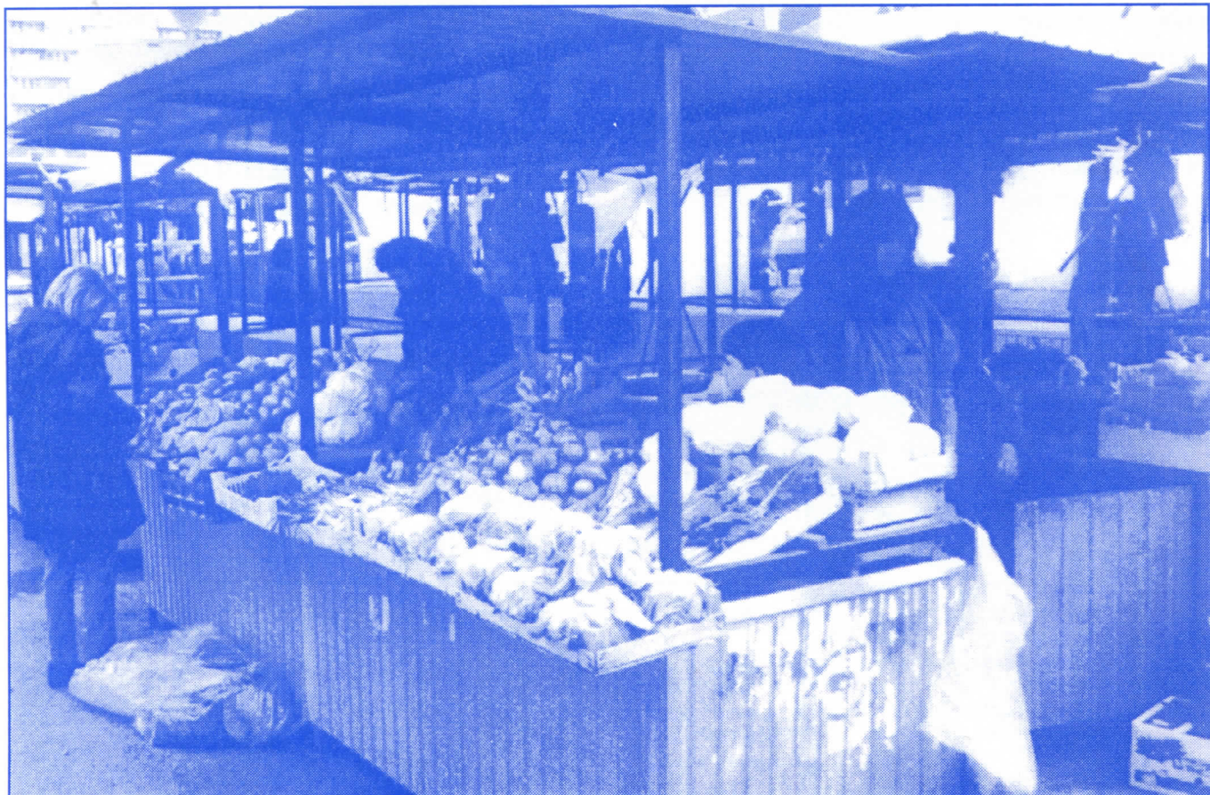
Српски радикали вратиће Каленићеву пијацу њеној изворној намени

Када поклоните своје поверење српским радикалима, ваш нови одборник биће вам увек