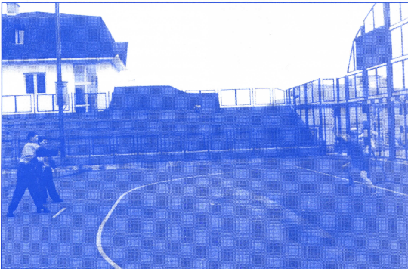
Један од приоритета српских радикала: реконструкција постојећих и изградња нових спортских терена

Када поклоните своје поверење српским радикалима, ваш нови одборник биће вам увек