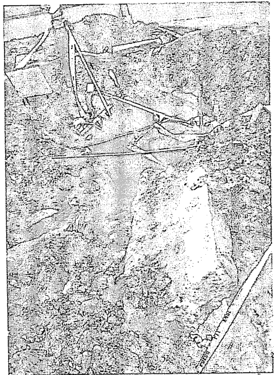
КАКО РАДЕ ЦАБА ИХ БИЛО

Актуелна власт како на Републичком тако и на локалном нивоу не предузима мере редовног вакцинисања (да је предузела не би до овога ни дошло) што доводи до великих последица.