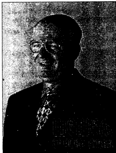
ШЕШЕЉ – СРПСКИ ЈУНАК

Пре две године Србија је испратила свог ратника у још једну битку. Испратили смо га са малом зебњом, али и са поносом. Српска радикална странка је данас поносна на Др Војислава Шешеља. Отишао је да се бори са Хашким трибуналом, монструозном творевином, која има циљ и задатак да суди само једном народу који се дрзнуо да брани свој опстанак, своја огњишта и своју слободу.