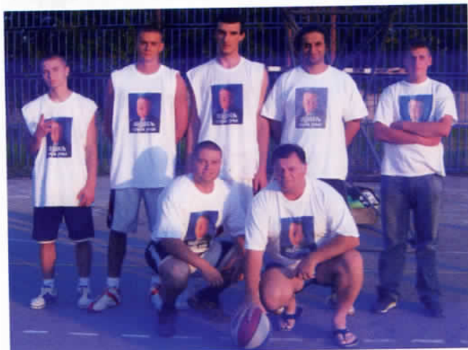
Шешељевци на кошаркашком турниру у Лапову опет први

СТРАНКА јер једино она има снаге да се супростави моћницима који до сада нису изгубили ни једне изборе, а воле да одређују судбину обичних грађана. Само ми имамо снаге и младе људе који могу да изнесу тај терет и извуку општину из учмалости и пропадања.