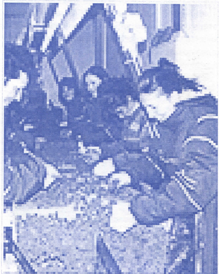
Задовољство хладњачара пуне хладљаче

Власт која се бави само својим проблемима, намицањем тесне већине у скупштини и трговином посланичким гласовима, нема времена за свој народ и за озбиљне проблеме.