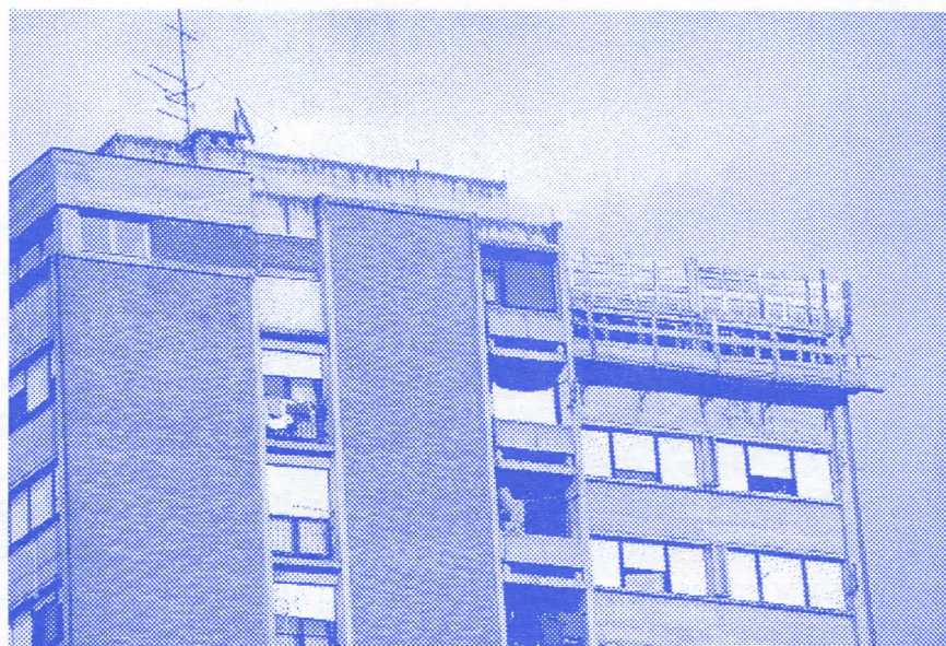
Храброст или знање ?!