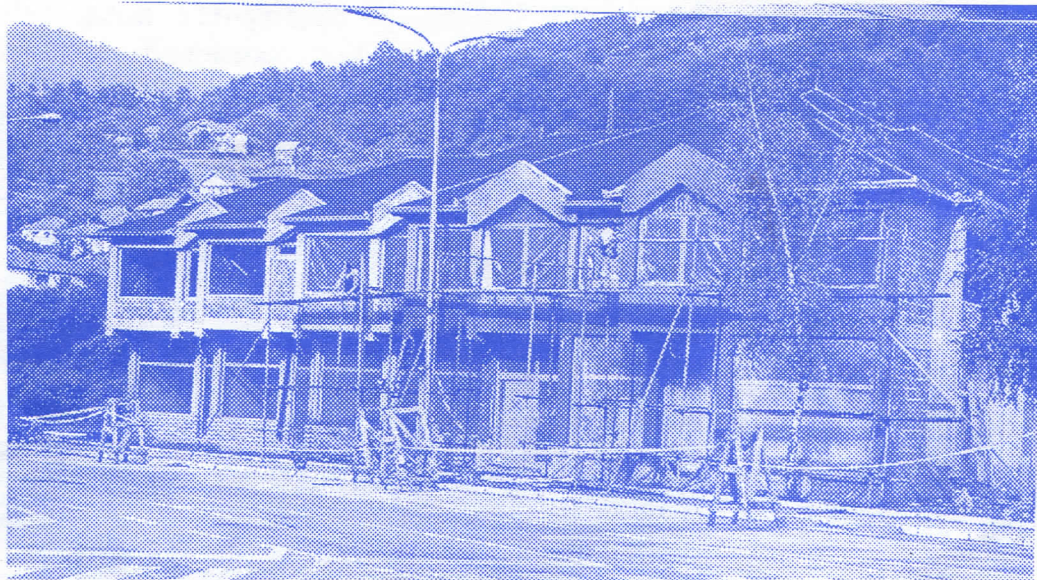
Ко ли је овде збуњен?

Архитектура је наука, али и уметност. Лепота није универзална категорија, али је ипак мерљива. Оно што раде Прибоју превазилази све границе и укуса и морала и струке. Овде је на делу принцип да се све може купити. Инжењери продају струку, директор ФАП-а земљу која није његова, држава нас одавно заборавила, а председник општине се вешто прави збуњен.