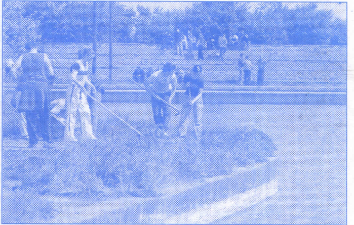
Уређивање Старог језера

- основан је Одбор за заштиту животне средине који ће чинити радна група анга-