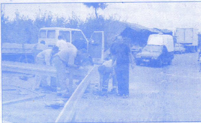
Уређивање прилаза Кванташкој пијаци

Организован је и спроведен бесплатан преглед и дефектажа котлова у свим школама наше општине са предлогом мера за несметан почетак грејне сезоне.