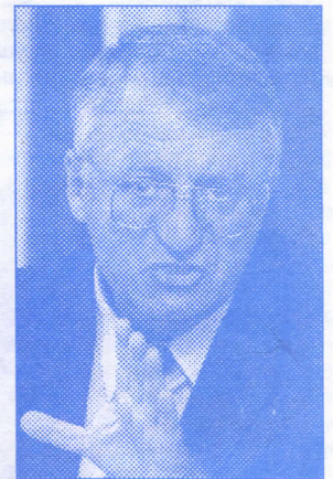
Др Војислав Шешељ