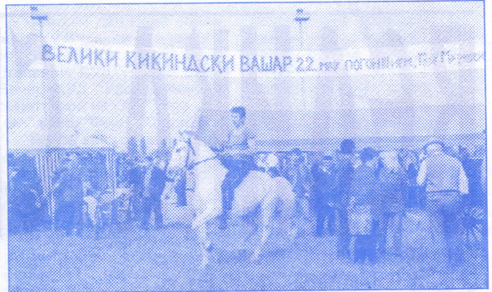
Велики Кикиндски вашар

У току су преговори о формирању Удружења произво-