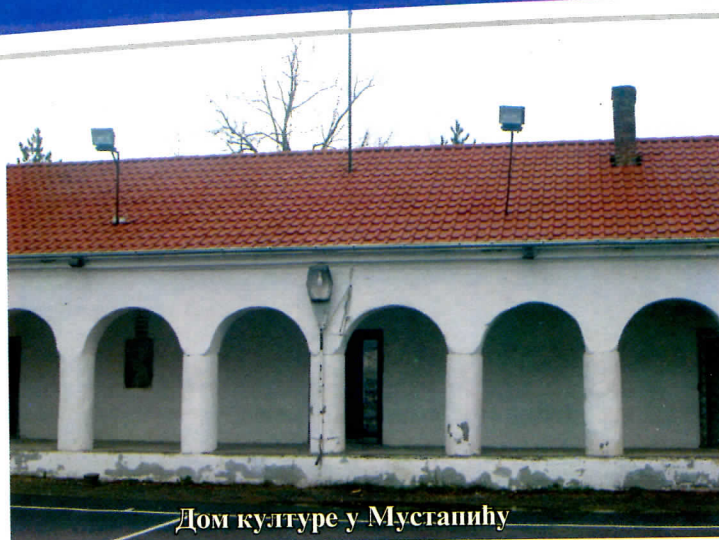
Дом културе у Мустапићу

Током 2005. године Општинска управа Кучево је направила корак више у односу на општине у окружењу, а то је формирање и отварање УСЛУЖНОГ ЦЕНТРА ЗА ГРАЂАНЕ. Наиме отварањем оваквог услужног центра настоји се да се општина приближи вама грађанима, како би сте могли да на једном месту у што краћем року добијете потребна документа везана за послове матичне службе, урбанизма, грађевине, приватног предизетништва, дечије заштите, борачко-инвалидске заштите, бирачких спискова, што значи да ви грађани општине Кучево у наредном периоду нећете морати да идете у Пожаревац или Мајданпек да би сте извадили извод из матичне књиге рођених, већ ће те то моћи да добијете у нашој општини, а такође и за многа друга документа за која сте морали да се обраћате надлежним министарствима, у наредном периоду моћи ће те да добијете у свом Услужном центру.