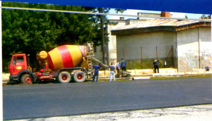
Асфалтирање школског дворишта

У насељу Волуја изграђен је темељ за цркву Свете Петке.