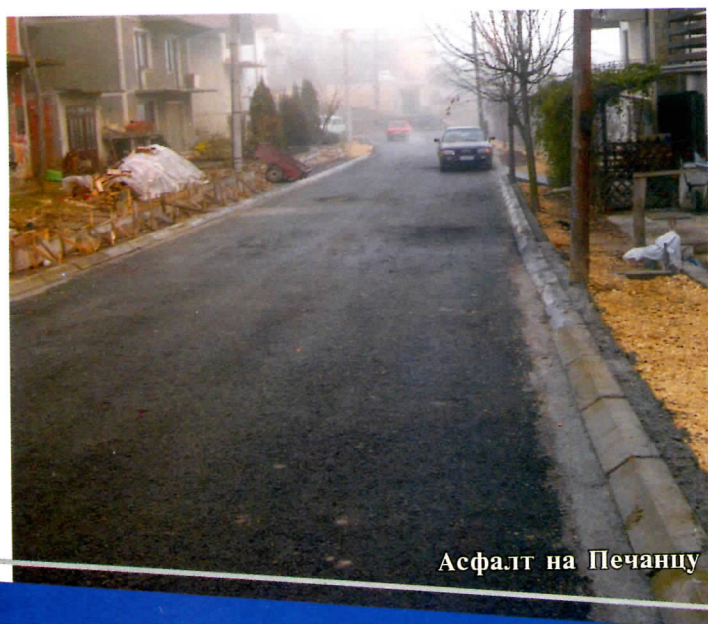
Асфалт на Печанцу

Прво што је путна мрежа веома разграната, 140 км. локалних и 250 км. некатегорисаних путева и