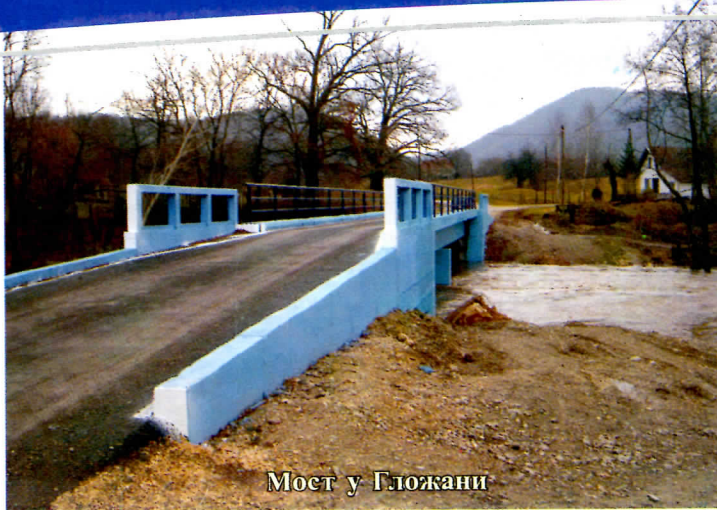
Мост у Гложани

У сарадњи са директорима школа и вртића, сагледали смо стање и потребе. Успели смо да нашој деци обезбедимо нормалне услове за игру и учење. У наредном периоду надамо се да ће Република значајно помоћи да се услови побољшају.