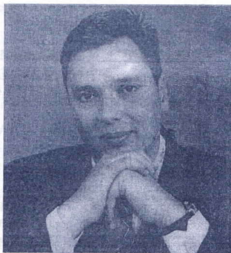
Генерални секретар СРС Александар Вучић