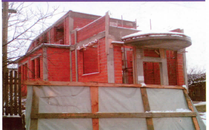
АДВЕНТИСТИ-СУБОТАРИ ГРАДЕ СВОЈ ХРАМ НА 20 МЕТРА ОД ЦРКВЕ И ДВЕ ШКОЛЕ