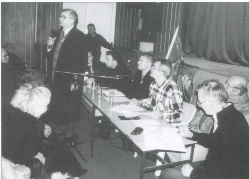
ГОДИШЊА СКУПШТИНА 29. 01. 2006. ГОД.