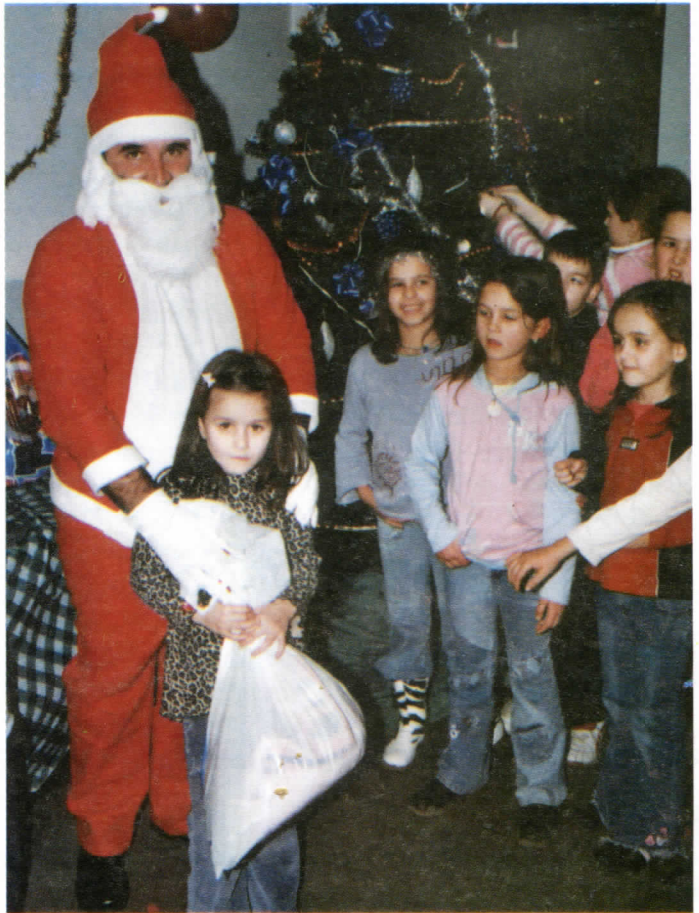
Нико не уме да се радује као деца

Стотинак деце радовало се пригодним поклонима, који су им, уз присуство и њихових родитеља подељени 28. децембра прошле године у просторијама Општинског одбора Српске радикалне странке Раковица. Весела и насмејана дечја лица, а што илуструје и слика приложена уз текст, уз јелку и Деда Мраза, највећа су награда организатору, а нарочито многобројним познатим солистима народне музике, оркестру, културно-уметничким друштвима и хумористима који су од свег срца пуна четири сата дали све од себе да овај концерт остане у најлепшем сећању свих посетилаца који су овим поводом после дужег времена напунили биоскопску салу. Нико од учесника овог хуманитарног концерта није радио посебну најаву. И управо је због тога њихова људска и уметничка величина још већа. Хуманост је велика сама по себи и њој није потребно никакво