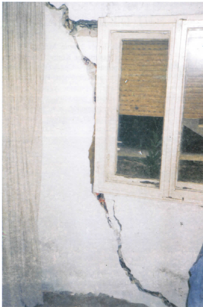
У оваквим кућама живе породице са децом

Морамо нагласити да је број тешкоћа којима су изложени грађани Ресника због немарности или неспособности власти, далеко већи, и о њима ћемо писати у следећем броју раковичког издања "Велике Србије".