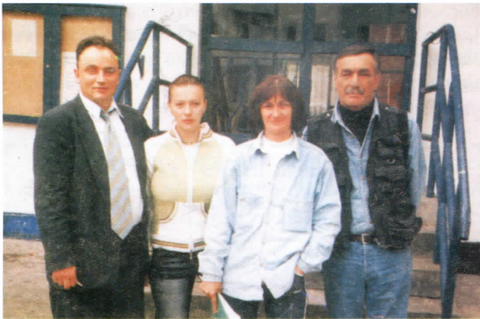
Активисти Српске радикалне странке на терену

М есна заједница Кошутњак по много чему представља зелену оазу Раковице. Има доста зелених површина, спортских терена, нарочито у Спорском центру "Пионирски град", са стазама за трчање и шетњу и друге облике спорских активности и рекреације. Имајући у виду да се додирују са општином Савски Венац у самом подножју дедињске шуме логично је очекивати да ова месна заједница по својој уређености бар приближно прати развој осталих делова централних зона Београда.