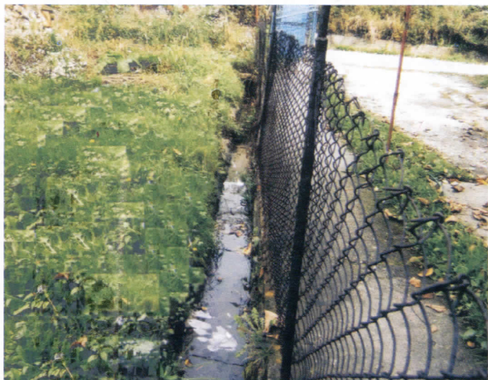
Зараза тече у Топчидерску реку