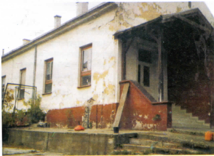
Неред и запуштеност

У неком од претходних бројева листа "Велика Србија", издања за Раковицу, већ смо писали о Месној заједници Миљаковачки извори. Међутим ако се само мало дубље зађе у унутрашњост овог насеља може се видети да и свакодневно писање не би било довољно да опише немар власти према овој месној заједници што је довело до хаотичног стања и крајње запуштености скоро у свим сегментима живота. Нема сумње да је овакав однос крајње неодговоран и према Миљаковачким изворима који би могли да буду стедиште многобројних културних збивања Раковице у Миљаковачкој шуми јединој зеленој оази у непосредној близини раковичког индустријског гротла.