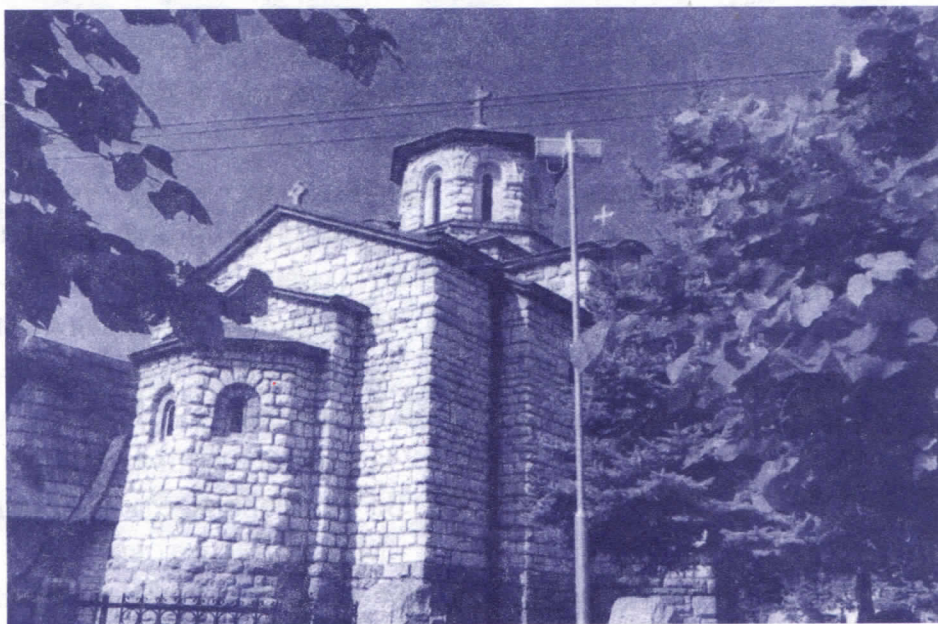
Црква у Крупуњу