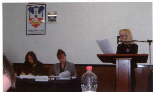
Одборници радикала у расправи на седници