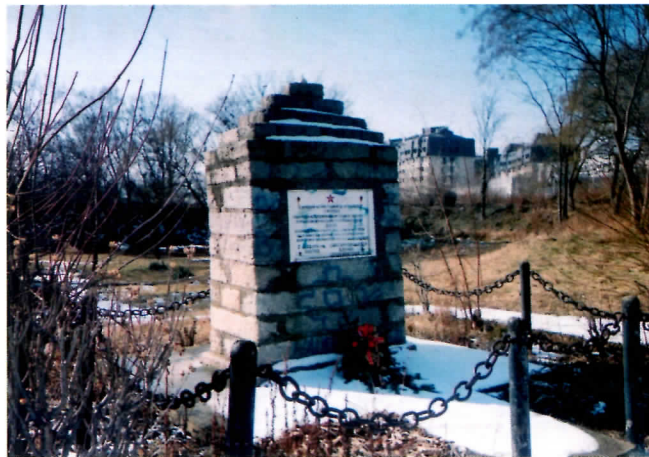
Непоштовање родољуба Србије

Спомен обележје потпуно је исцртано графитима, обрасло је шипражијем и драчом, а у непосредној близини налази се велики број разбијених флаша, бачених картона и папира, као и разног другог смећа.