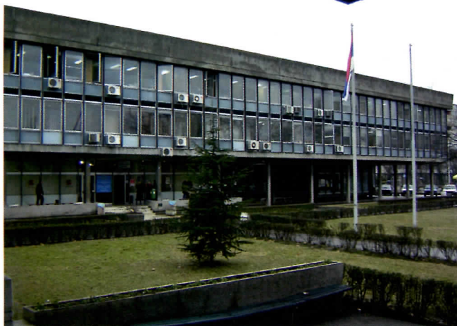
Општинска власт малтретира мајку палог војника