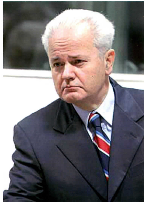
Убијен јер је бранио Србију

Ми питамо да ли се то можда Борис Тадић и њихови прљави медији, а не зна се који је прљавији, посебно од електронских, предводи их Б92 наравно, а не заостају ни Пинк ни РТС, ни остали. Јесу ли се то уплашили броја људи на сахрани у Београду? Јер су се то уплашили можда да се види колико ће људи да дође да ода почаст, последњу пошту Слободану Милошевићу? Јер их то брине? Па зато хоће да буде сахрањен у Москви? Зато малтретирају