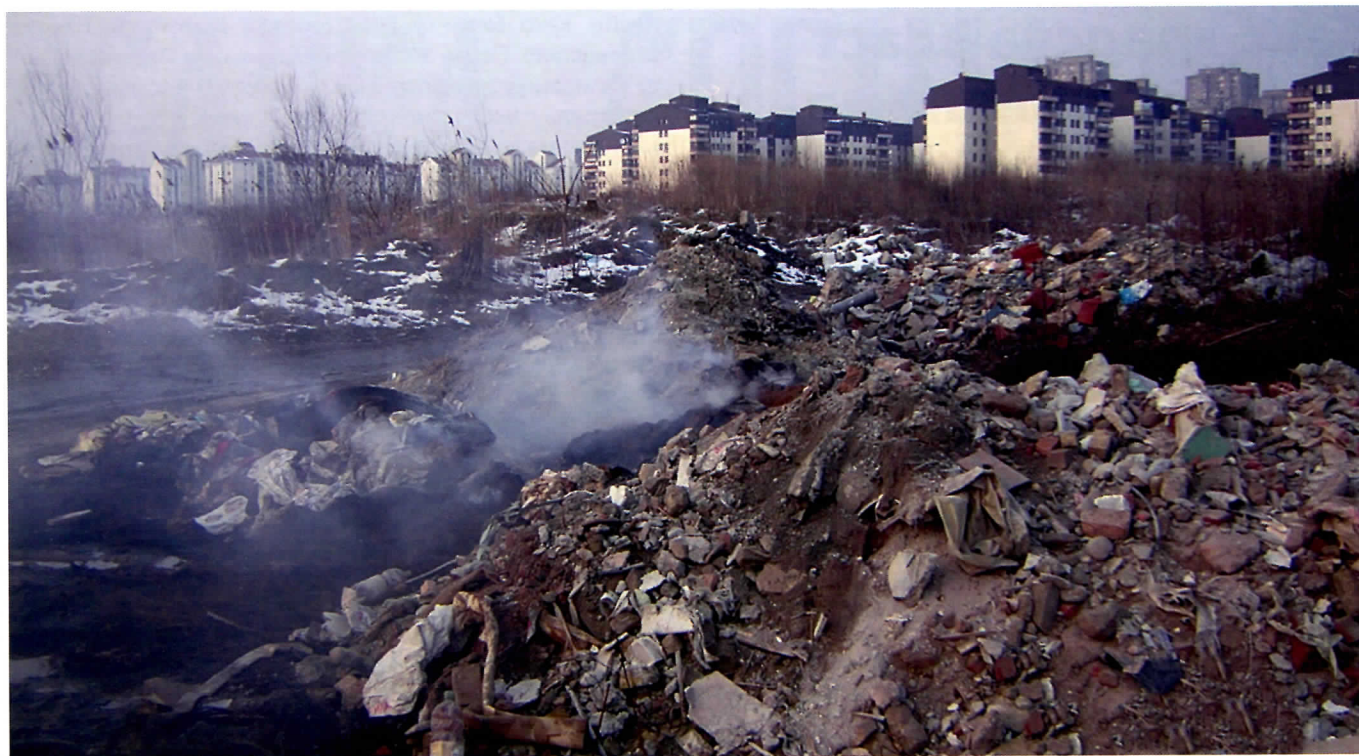
Нова туристичка дестинација у Новом Београду

Од свих позваних да дођу на лице места, одазвали су се, истине ради, само ватрогасци, док је Комунална инспекција саветовала грађане да сами пријаве долазак камиона са отпадом, што су станари и чинили, али се њиховим позивом све завршило, јер нико није реаговао. Имају надлежни ваљда, преча посла од депоније која угрожава живот хиљаде људи-пре свега, деце.