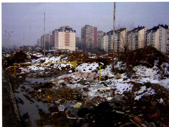
Депонија „Монт Еверест“

Грађани улице др Ивана Рибара били су упорни у доказивању катастрофе која им прети, па су у априлу месецу 2004. године у поноћ довели телевизијске камере да сниме паљење више од 200 гума. На жалост, Министарство за екологију поводом овог случаја изјавило је да није надлежно, али је прилог, објављен на телевизији, ипак утицао да се после 2-3 дана на депонији појави неколико камиона „Београд пута“ и „Зеленила“, који су практично само разгрнули отпад - да би у штампаним медијима објавили како су очистили депонију и ставили гвоздене стубиће, што наравно, није истина.