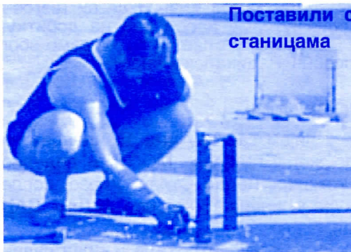
Поставили смо клупе на аутобуским станицама

Урадили смо проширење Новог гробља, уредили околину и оградиле са бетонско-жичаном оградом