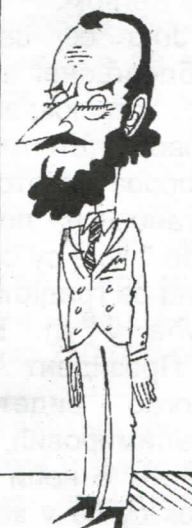
Вуково морално огледало