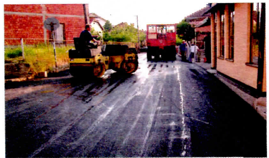
Ул. Велибора Стајића