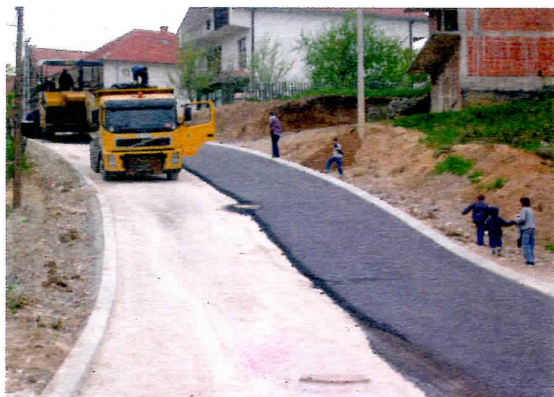
Ул. Новице Дојчиновића, коначно завршена

И поред свега наведенога у ЈП „Дирекција за грађевинско земљиште и путеве“ је последњих неколико недеља врло живо и радно. Темпом којим се кренуло 2005.год. наставило се и ове. Чињеница је да ће и ове године предузеће бити оптерећено дуговима које су претходници оставили али ће се настојати да се извуче максимум. Дугови се односе