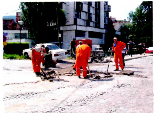
Све ударне рупе у граду покрпљене