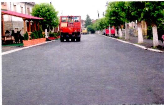
Ул. Милоша Обилића-нови асфалт