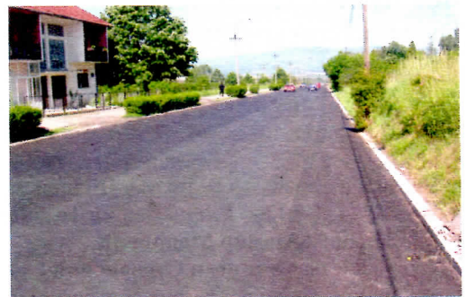
Магистрални пут М1/13 - прошле године започет, а ове завршен.