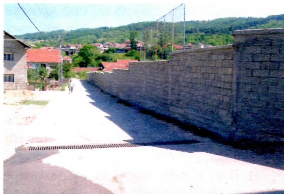
Нови зид на градском стадиону

Оснивач и издавач: Др Војислав Шешел Гл. и одговорни уредник: Елена Божић Талијан Заменик: Момир Марковић Уредник Издања: Дрган Стевановић Новине "Велика Србија" уписане су у регистар средстава јавног информисања Министарства за информације под бројем 1104 од 05. 06.1991.год.