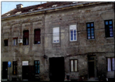
Фасада у улици Карађорђева 17 (Летњиковац Наталије Обреновић)

И ако је фасада зграде у Господар Јевремовој 59 где живи премијер била у одличном стању, средства су одмах одобрена и приступило се обнављању фасаде. За њих увек има новца и ако су огромна средства у питању. А зграде које су културно-историјски споменици могу да сачекају још коју деценију.