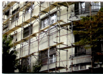
Имају "паметнија" посла... (реновира се дом Војислава Коштунице)