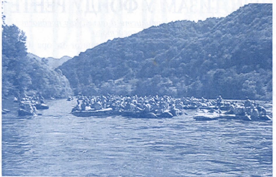
Велики број учесника и ове године

Из изложеног је јасно да се Тара скоро и не помиње у овом Програму. Зашто, ако иста политичка опција врши власт и на локалном и на републичком нивоу. Зашто локални властодршци нису убедили своје ministre и обезбедили средства за изградњу ски-стаза и на Тари.