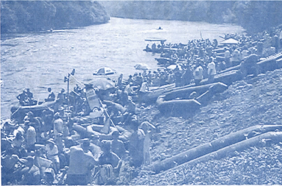
Неуређен прилаз Дрини

Велико интересовање за туристичке дестинације у нашој општини. Летња туристичка сезона дочекана неспремно.