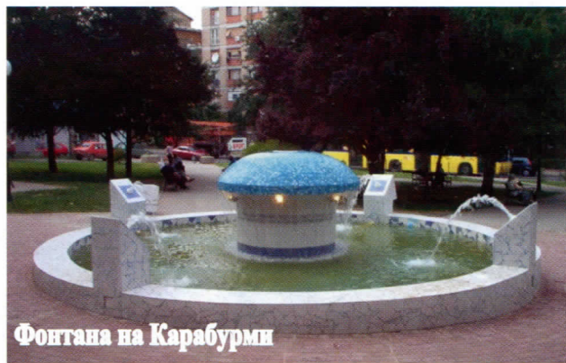
Фонтана на Карабурми

Решићемо их баласта власти на наредним изборима. Очито да су се изморили улажући у себе.