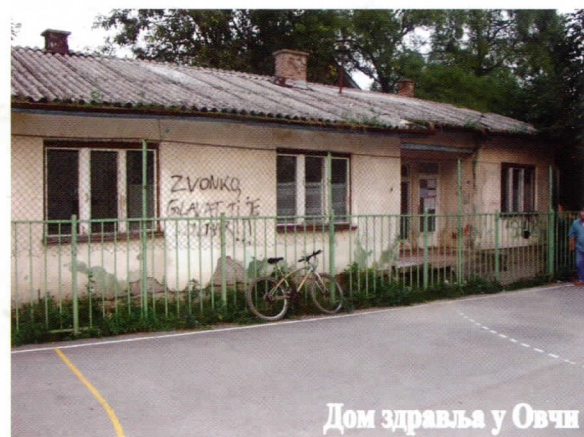
Дом здравља у Овчи

Палилула је за Српску радикалну странку јединствена целина, док мештани сами не одлуче да то другачије буде. С тим у вези – Српска радикална странка сматра да се сви делови Палилуле морају потпуно равномерно развијати, али стална улагања на једном делу општине 'гура прст у око' годинама запостављеним. Посреди је чиста прљава игра тзв. демократског блока Палилуле