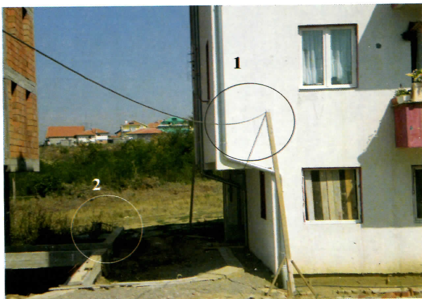
1. струјни кабл 2. црева од чесме до стана