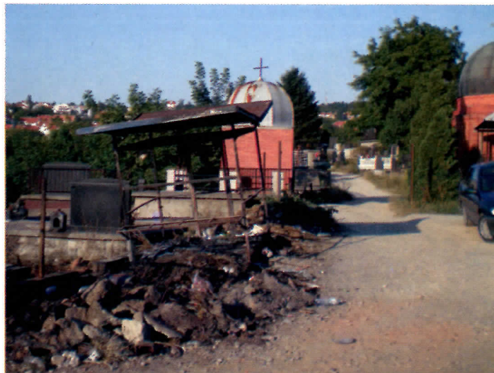
Депонија смећа – најлакше спалити

Гробље нема изграђену инфраструктуру (осветљење, разведену воду, стазе), нема канте за отпатке, нема канализацију, али има мали поток са фекалним водама које се сливају из насеља што представља велики проблем, посебно у време киша, који прети да постане жариште заразе. Често несавесни грађани пале ђубре на гробљу па се дешава да изгоре и поједини гробови.