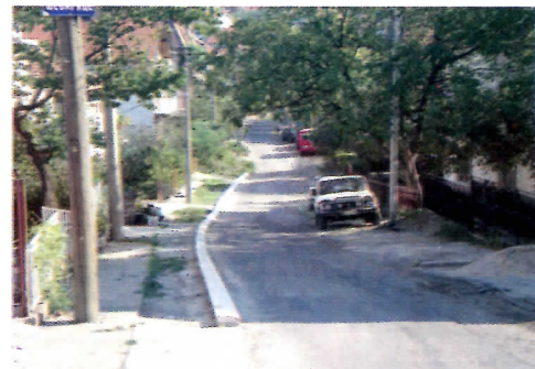
могла би бити и права и двосмерна

Радови на саобраћајницама постали су права напаст за становнике Звездаре. Није проблем када се они изводе квалитетно и за дужи временски период, али није тако. Неке улице се асфалтирају више пута, као што је случај са Поп Стојановом где је асфалтирано чак четири пута (обнова улице, канализација, опет канализација, па топловод). Да ли су јавна градска предузећа некординирана или неко узима новац? Овакви проблеми су све чешћи посебно пред изборе кад се асфалтирају прометне саобраћајнице често без потребе, осим за потребе кампање. Становници у улици Шеварице имају други проблем – ивичњак по сред улице као да ће пешачком стазом ићи аутомобили (види слику), наравно иако плаћена (пре више година), канализација ће се спровести неки други пут.