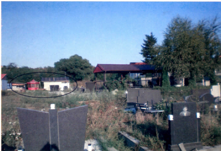
И киосци ничу – приватно гробље у Малом Мокром лугу

Поред тога што је постало депонија смећа и легло заразе када је у питању гробље, грађане занима могућност куповине гробног места пошто је добар део површине гробља заузет. Земљиште у околини гробља је у приватном власништву па су се земљопоседници (њих преко 20) досетили и развили нови бизнис – продаја гробних места. Питање је само да ли за такву врсту предузетништва имају дозволу Општине, јер су неки успели да продају на десетине гробних места по цени већој од 500 евра. Судећи по уређености тих површина рекло би се да за тако нешто Општина није издала дозволу (а није ни ЈКП „Погребне услуге”, јер, како кажу, то гробље није у њиховој надлежности) и да је ствар измакла контроли, што је, вероватно, последица договора између земљопоседника и неког из општине.