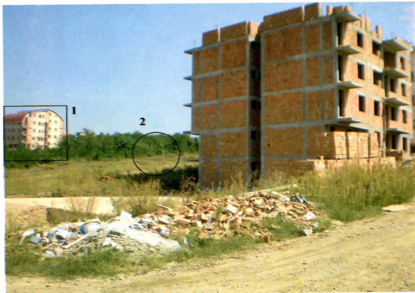
1. зграда као у центру града 2. струјни кабл између зграда

По предмету број 356-456/05 од 29.11.2005. године донето је решење о рушењу новијег стамбеног објекта (на слици лево) крај већ поменутих зграда у улици Душана Срезејевића бб у време када је објекат тек био започет (на ортофото снимку из 2005. године уочава се темељ). Општинска инспекција обавештава НН лице да ће „наставити“ са рушењем 25.05.2007. године. Поставља се више питања: Зашто НН лице, када се зна ко је инвеститор? Шта се чекало две године? Зашто објекат ни после три месеца није порушен? Све указује на рекетирање инвеститора од општинара. Прво су му дозволили да уложи одређена средства у објекат и гради бесправно, да би му касније под претњом рушења изнуђивали новац.