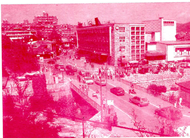
Општина Нови Пазар

Грађанима Новог Пазара је добро позната власт коју чине Војислав Коштуница, Велимир Илић и Сулејман Угљанин, лидер СДА и председник општине Нови Пазар. Ова добро уходана тројка, различитих политичких и програмских опредељења, а заједничких материјалних интереса, већ више од две године држе власт како на републичком, тако и на локалном нивоу. Наиме подршком опстанка предходне владе Војислава Коштунице, два посланика листе за санџак, заузврат добијају незаконито распуштање парламента општине Нови Пазар. Након изборне лакрдије и изборног безакоња поменуте странке су утрошиле огромне количине новца, ангажујући приватне фирме из града и околних општина, неби ли посули шодером што више улица и сеоских