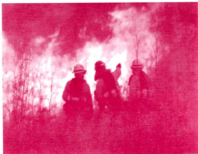
ватрогасци у акцији гашења пожара