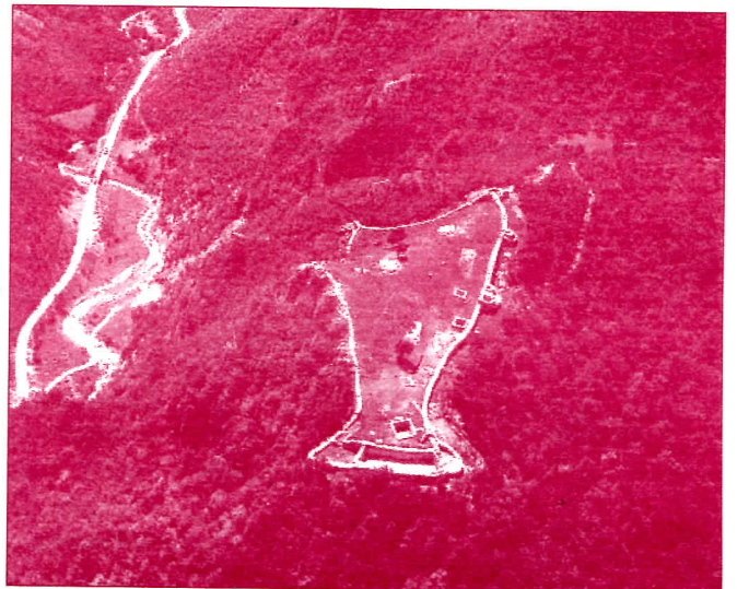
Остаци Немањине државе из XII века

који се заузврат одрекао богате области Дендра у близини Ниша. после Десе на рашком престоу помиње се жупан Тихомир, брат Стефана Немање, из породице која је ублиском сродству са рашком и зетском династијом. Њихов отац Завида био је принуђен да у првој половини 12. века избегне у Зету, а син Немања му се родио у Рибници и крштен је по латинском обреду, да би поново био крштен по православном обреду када се породица вратила у Рас.