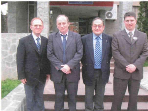
Бугарски амбасадор и конзул у Сурдулици

Пред нама су, по много чему, одлучујући парламентарни и локални избори 11. маја. Свакодневно смо сведоци еуфоричне, прљаве, бескрупулозне кампање готово свих актуелних актера како на државној, тако и на локалној политичкој сцени. Претње, уцењивање, најчешће празна и паушална обећања, ситни поклони, мањи или већи новац су непрекидно у игри. И све то дају (додуше тешко и ретко) или обећавају (лако, али неаргументовано) управо они који су се годинама уназад "показали" и на државној и на локалној политичкој сцени. Ових дана сви су обећали све , нисам сигуран да је остало места ни за једно једино поштено и реално обећање. Можда за једно, и можда управо за моје.