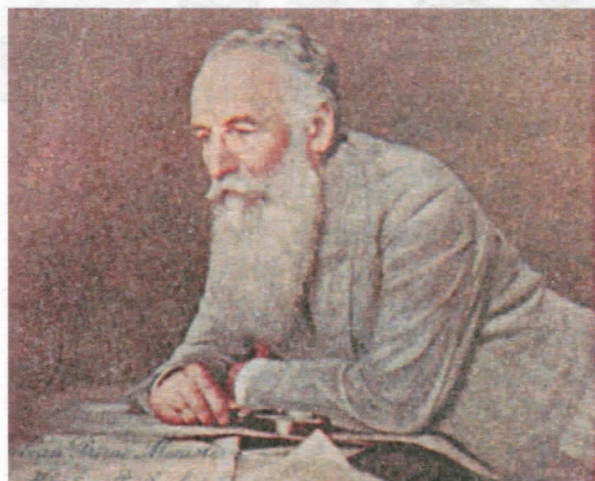
Никола Пашић – радикали на челу српске Владе у најтежим историјским тренуцима

4. СРПСКА РАДИКАЛНА СТРАНКА За слободну и поносну Србију